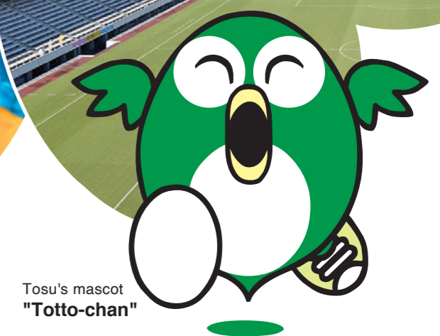
Tosu's mascot "Totto-chan"